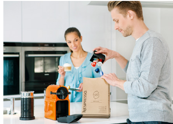
Nespresso baut sein globales Recyclingprogramm weiter aus und investierte im 2017 CHF 25 Millionen.

Senkung unserer THG-Emissionen (Scope 1 und 2) pro Tonne Produkt seit 2007