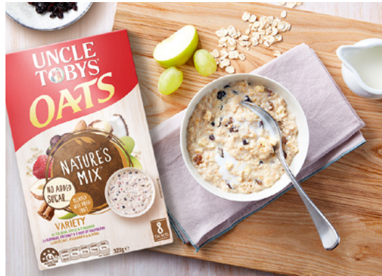
Uncle Tobys, die führende Haferflockenmarke in Australien, brachte Nature's Mix auf den Markt. Das Sortiment ist frei von zugesetztem Zucker und ausschliesslich mit Trockenfrüchten und Nüssen gesüsst.

Im Einklang mit dem Bestreben unseres Gründers Henri Nestlé und unserer Ausrichtung auf Ernährung arbeiten wir gemeinsam mit unseren Partnern daran, Nahrungsmittel und Getränke bereitzustellen, die ein gesünderes und glücklicheres Leben ermöglichen. Wir verpflichten uns zu konkreten Zielen, um unser Portfolio noch gesünder und schmackhafter zu machen, Konsumenten dazu anzuregen, ein gesünderes Leben zu führen, und Wissen über den Zusammenhang von Ernährung und Gesundheit aufzubauen und zu teilen.